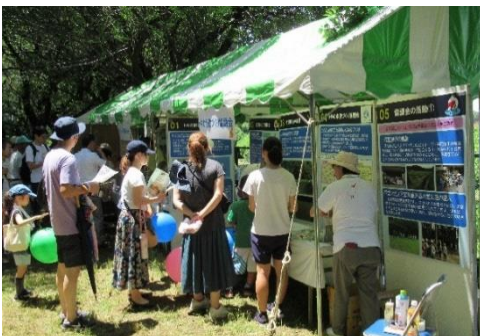
(首都圏でのPR活動（清瀬市）)