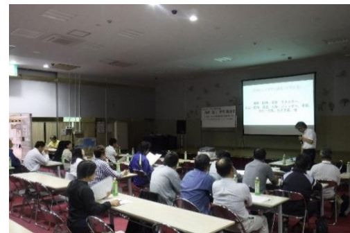
(地域づくり勉強会)