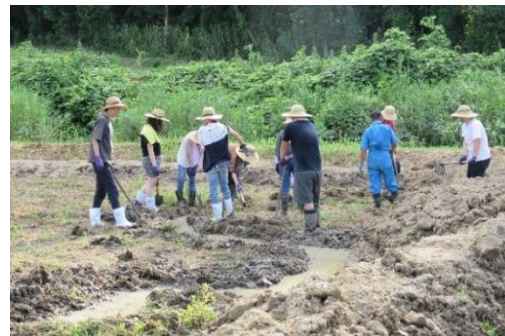
(学生ボランティアの受入（ビオトープ）)