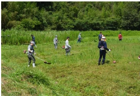
(学生ボランティアの受入（草刈り）)