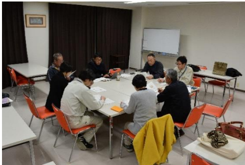
(毎月開催の役員会)