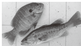
ブルーギル(左)と ブラックバス(右)