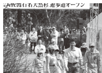
知事と遊歩道の渡り初め