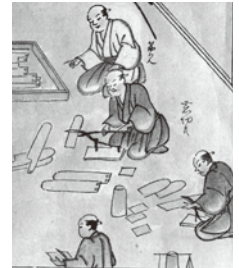
「佐渡鉱山往時之稼行絵巻」より