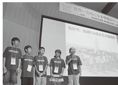
8月9日、東京大学で行われた「世界一田めになる学校」で、佐渡での取組みを発表しました。

佐渡Kids生きもの調査隊では、随時隊員を募集しています。詳しくは、市役所農林水産課生物多様性推進室（☎63-3761）まで！