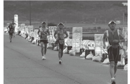
八反ぼんぼりの夜間照明