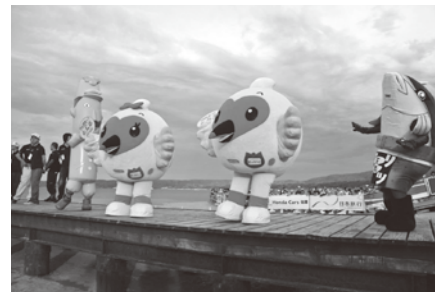
ゆるキャラも応援