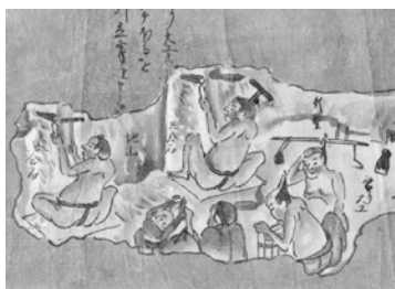
裸姿の金穿大工たち。着物を着ているのが穿子。(佐渡銀山往時之稼行絵巻より)

穿子の手配を請け負うのが「穿子請」、その手代に「穿子頭」がいて、穿子たちを管理します。敷内で穿子を差配するのを「穿子遣」といい、様々な役割がありました。