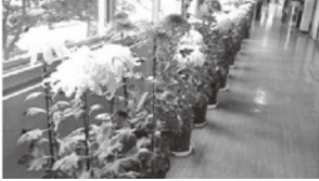
文化祭で飾られた大菊

本校の年間のめあては「ほほほか言葉でここに笑顔」の実践です。上級生と下級生が互いに協力し合う縦割班活動を大切に行います。運動会や文化祭等の行事では、学年の枠を超えたプロジェクト活動を行い、児童が主体的に行事に関わることで、「思いやり」や「自主性」を育てています。本校の特色ある教育活動の一つに6年生が行う「大菊づくり」があります。