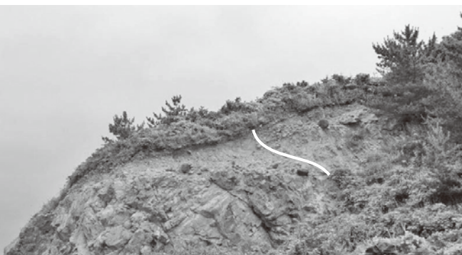
図1 大須鼻の活断層 丸い大きな石がずれているのがわかる