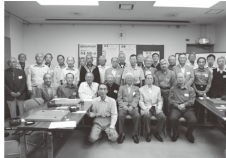
対局前の集合写真

表彰式の後は、近くの庄やで恒例の懇親会を開催。熱戦の後の喉を潤し、反省と自慢話でまた一段と親交を深め、次回の再会を約束して散会となった。（文責・佐渡市東京事務所 小路 徹）