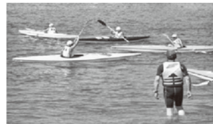
マリンスポーツ体験

もう一つは5年生が行う自然宿泊体験活動です。毎年「素浜青少年自然の家」でキャンプをしています。飯ごう炊飯やテント張りの他、カヌーやバナナボート等のマリンスポーツ体験をします。みんなその時は大喜びです。そのような楽しい体験をしながら、自然に親しむとともに、好ましい人間関係や集団生活の在り方を学習します。