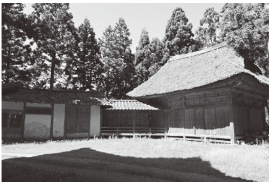
長江熱串彦神社能舞台