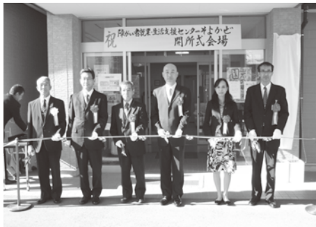
10月18日に行われた開所式