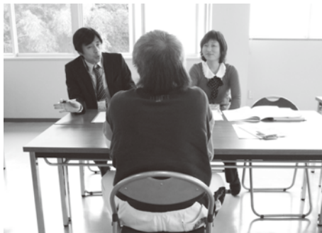
就業、生活支援担当者による面談の様子

○障がい者就業・生活支援センターとは 就職を希望する、または在職中で障がいのある方が抱える課題に応じた雇用および福祉の関係機関と連携し、就業面および生活面の一体的な支援を行います。