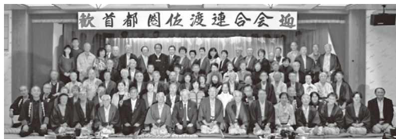
ホテル万長・懇親会にて高野市長、金光市議会議長を囲んで