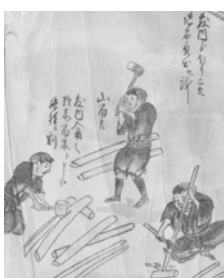
留木を作る山留大工たち