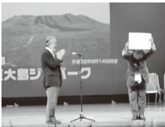
今年認定された地域への認定証授与

洞爺湖大会では、新たに認定された地域への認定証の授与をはじめ、各地の事例紹介や分科会、そして、講演会など内容の濃い大会でした。参加者は、分科会や見学会などで活発に意見を交換してい