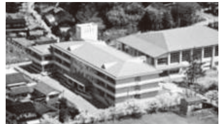
現在の羽茂小学校

平成22年4月、小村小学校、大滝小学校と統合。旧羽茂地区の小学校が一つとなり、新生「羽茂小学校」が開始しました。