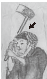
「天辺（矢印）」をかぶる山留大工