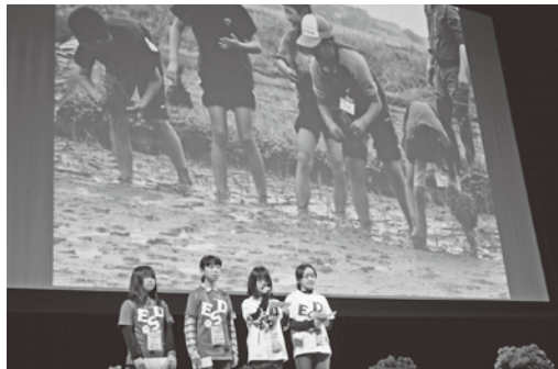
佐渡kids生きもの調査隊による発表の様子