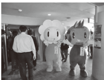
各地のジオパークキャラクターがお出迎え