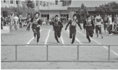
近代五種リレー競技 20代のイケメン？パラダイス

小さな子どもたちからおじいちゃん、おばあちゃんまで勢ぞろいし、久しぶりに小木地区の老若男女が集いました。熱戦を見つめ応援する声、必死に駆け抜けていく