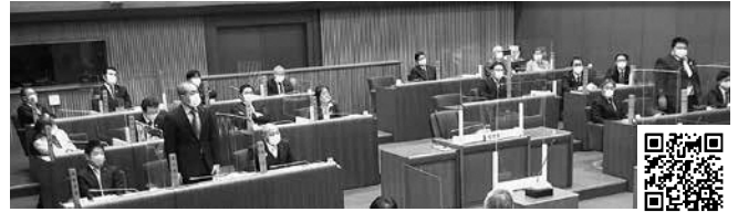
本会議採決の様相 (1月20日)