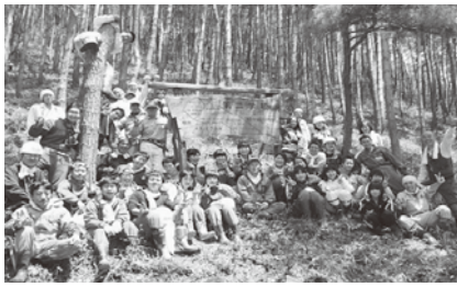
春の学校林作業（第二学校林）

松ヶ崎中学校といえは「学校林」といわれるほど伝統があるのが学校林活動です。創立まもない昭和25年に松の植林を始め、その後現在に至るまで毎年、学校林の作業を行ってきました。残念ながら第一学校林は、松枯れで全て伐採して、学校の管理を離れましたが、第二から第四学校林では、現在も生徒達が保護者や地域の皆様の協