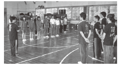
第1回鼓童交流会（鼓童研修所・旧岩首中）