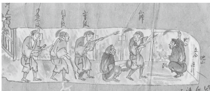
間切改め。奉行所の役人や振矩師は天辺をかぶっている。（「佐渡銀山往時之稼行絵巻」から）

だのか、山方役・目付役・御番所役立会いのもとに検査を行っています。先頭で「間縄」（巻尺）を持って距離を測っているのが振矩師です。宝暦く文政年間（1751〜1839）の頃の振矩師の待遇は二人扶持（1日あたり米1升）、御給銭1貫348文。この下に「見習」「助」「助見習」がいました。