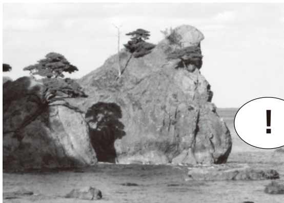
(写真1)見立にある千鳥岩