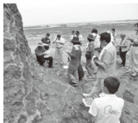
ジオパークについて 真剣に学ぶ受講生たち