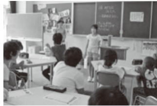
全校エンカウター

もう一つは全校エンカウター（人間関係づくり）です。適切な人間関係を育む力や社会性など、集団生活を営む上で必要とされるスキルを全校で学習します。学級や学年で学ぶ機会に加え、心を育てる教育活動も