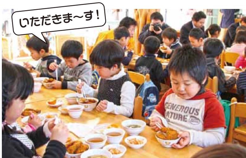
ブリカツくんも登場! 保育園「佐渡天然ブリカツ丼」給食 (写真は新穂トキっ子保育園)