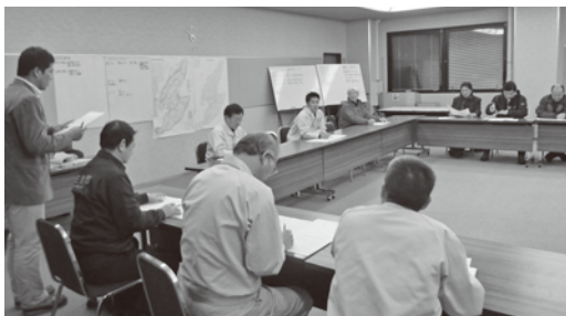
対策本部会議の様子

2月8日午後9時1分ごろ、佐渡沖を震源とする強い地震が発生、佐渡市で震度5強を観測しました。震源の深さは約14km、地震の規模（マグニチュード）は5.7。