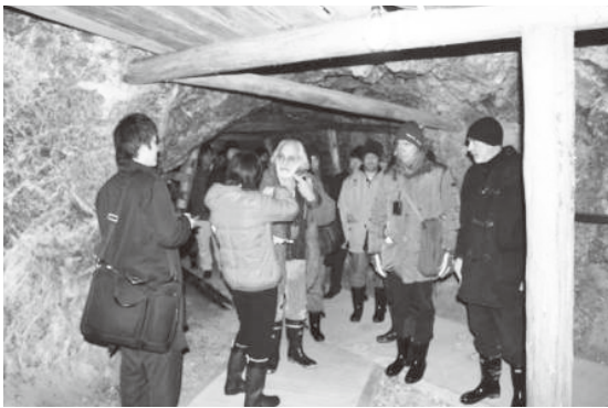
道遊坑を視察する イタリア文化財・文化活動省の専門家たち

化遺産の保護行政の発展に寄与することを目的に、2008年から始まったもの。今までに、世界遺産の紀伊山地の霊場と参詣道や白川郷、重要な文化的景観選定地区の長崎県平戸市で開催されています。