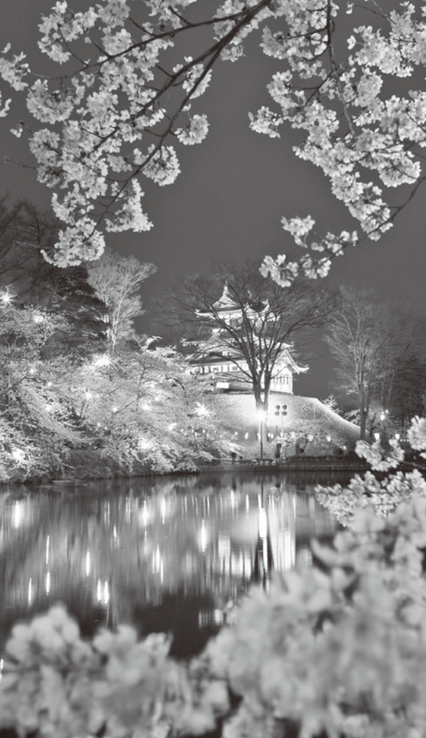
高田城三重櫓と夜桜