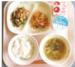
麦ごはん・牛乳・アジのフレッシュトマトマリネ・納豆和え・みそ汁・ミルクプリン

子どもたちと一緒に給食を食べていただいた保護者の方からは、「家では、野菜をあまり食べないのに、給食では残さず食べていたので、給食でどんどん出してください。」「給食当番をしっかりとがんばってやっていたので、家でももっとお手伝いを頼むといいのかな。」などの感想をいただきました。家庭と学校が連携し、未来を担う子どもたちに、望ましい食習慣を形成できるような食育の推進、ふるさとの味を誇りに思える地場産物や郷土料理を取り入れた給食を提供できるように努めたいと思います。