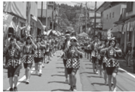
佐渡おけさ 羽茂まつり さて、恒例の羽茂まつりでは、全校生徒が佐渡おけさと総踊りを披露します。佐渡おけさの「静」と総踊りの「動」が見るものの心をつかみ、島の伝統の素晴らしさと未来に生きる子どもたちの元気を伝えます。

素直に、体一杯表現しようとする羽茂の子どもたちの心の原点は、羽茂が培ってきた文化と伝統であり、その中で子どもたちを育てようとする地域の皆様の熱い思いです。子どもたちは、地域というもう一つの学校で、「本物の文化」を学んでいるのです。 本校は、あと二年で小木中学校と統合し南佐渡中学校に生まれ変わります。両校の伝統が一つに交わり、すばらしい学校ができることを確信しています。