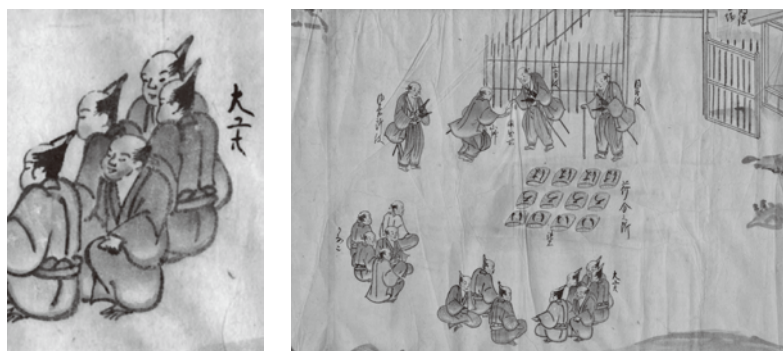
荷分けの図 大工たちの髪型は、「本多髷」といい、安永年間（1772～81）頃に江戸で流行したもの。（「佐渡金銀山往時之稼行絵巻」より）

役・番所役が、山師側からは金児や大工（金穿大工）たちが立ち会います。金児は坑内の採掘場を請け負っている経営者で、大工を雇っていました。