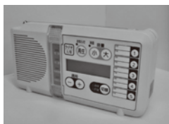
戸別受信機イメージ

市ではケーブルテレビ回線を活用して、各世帯に地震や災害の緊急情報等を受信できる戸別受信機を設置する「緊急情報伝達システム事業」を実施しています。