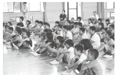
真剣に聞き入る両津吉井小の児童たち