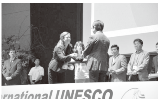
島原国際会議の様子

ジオパークと世界遺産が融合した島である済州島から、佐渡が学ぶことは多いのかもしれませんが。