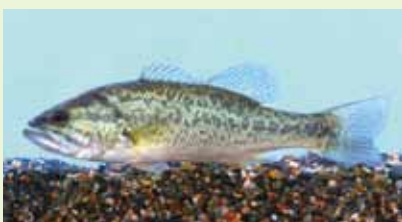
オオクチバス (ブラックバス)

違反した場合、個人の場合懲役3年以下もしくは300万円以下の罰金 / 法人の場合1億円以下の罰金に該当します。