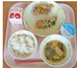
ごはん・牛乳・アジのフレッシュトマトマリネ・納豆和え・みそ汁・ミルクプリン

「佐渡市学校給食統一献立」は、佐渡市が自給自足の宝庫であり、また、食育の観点から地場産食材を活用して年3回実施するものです。