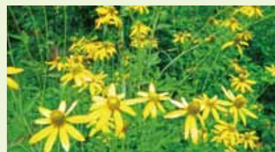
オオハンゴンソウ (花期は7月-8月頃)