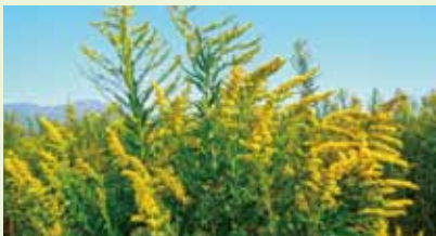
セイタカアワダチソウ (花期は10月-11月頃)

法による規制の対象外であるが、すでに日本に持ち込まれ、生態系に悪影響を及ぼすおそれのある動植物が指定されています。