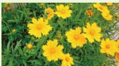
オオキンケイギク (花期は6月-7月頃)