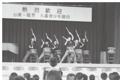
太鼓演奏を披露する台湾の子どもたち