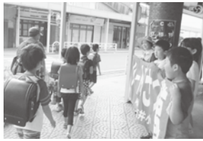
中学校区連携オアシス運動

両津港から徒歩5分という両津地区の中心に位置する校舎は、平成22年度から2年間にわたる大規模工事により、堅固できれいに生まれ変わりました。そんな恵まれた環境の中、今年度は177人が楽しく学校生活を送っています。当校では、長年あいさつ運動を行ってきました。