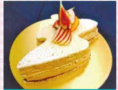
昨年10月に開催されたスイーツコンテストの最優秀作品「佐渡ヶ島」