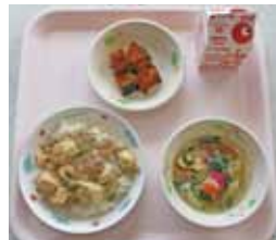
マーボー丼・牛乳・大学かぼちゃ・にらたま汁

小木小学校では、毎日新鮮な食材が届き、それをすぐに給食で食べることができます。生産に関わる地元の人への感謝の気持ちが育まれる環境で子どもたちは育っています。