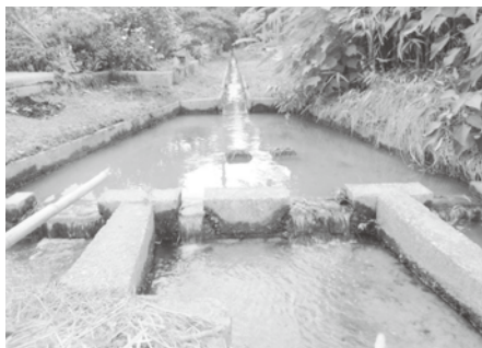
▲出口が複数にわかれている国中平野の江。

また、砂金を採るためにも江が利用されてきました。次回は、西三川編として、砂金山で利用されていた江をご紹介します。お楽しみに! ※「江」は、農家にとって、とても大切なものです。見学の際は、注意して観察を行ってください。