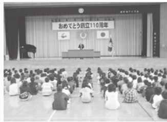
創立110周年記念式典

生委員の方も参加してください。今年度は創立110周年を記念し、創立記念日である5月25日に