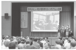
佐渡Kids生きもの調査隊による活動発表

10月8日、「生きものの人・共生の里を考えるシンポジウム」が、トキのむら元気館で開催され、多くの方からご来場いただきました。このシンポジウムは、大型希少鳥類