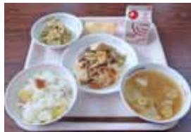
さつまいもごはん、牛乳、ぶたすき焼き、キャベツのごまあえ、打豆のみそ汁、りんご