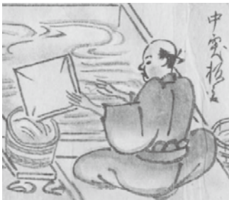
ゆり板を用いて、金銀を採取している。