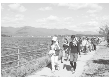
加茂湖周辺の遊歩道