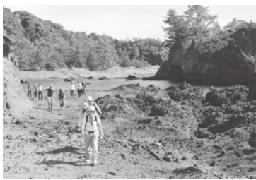
琴浦～宿根木遊歩道