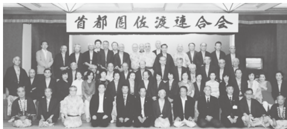
懇親会にて甲斐市長、祝市議会議長を囲んで(於：ホテル万長)