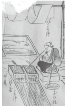
ねこ流しは女性が中心。いずれの絵巻にも乳飲み子を抱えた女性が描かれている。