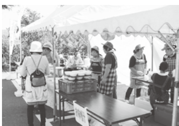
山菜汁のサービス

1日目は、「佐渡両津・トキとの出逢いのみち」で、おんどこドームをスタートし、牛尾神社やトキ交流会館、トキの森公園などを巡る12kmコースと、そこから更に、両津博物館や樹崎神社、加茂湖周辺を巡り、おんどこドームに戻る24kmコースでした。