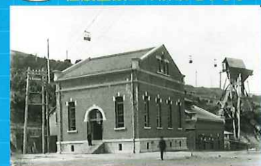
北沢火力発電所発電機室棟 (明治41年頃)