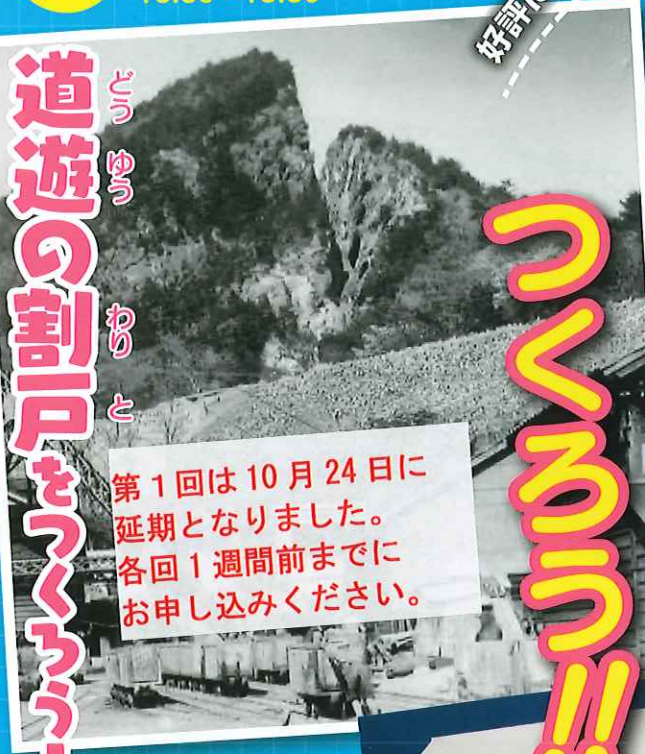
道遊の割戸 (昭和10年代)