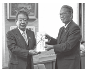
佐渡汽船運輸様による贈呈

12月19日、佐渡市トキ環境整備基金への寄附金贈呈式が行われ、佐渡汽船運輸様より31万5118円のご寄付をいただきました。