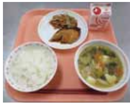
ごはん、牛乳、ぶりの照 焼き、きんぴらごぼう、 どさんこ汁