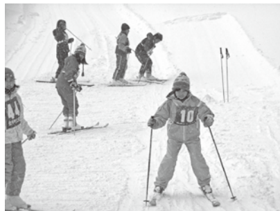
平スキー場での授業

島内では体験することが難しいスキーですが、自衛隊の方々のご指導の下、広いグレンデで歓声をあげながら楽しい一日を過ごしています。