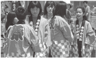
佐渡おけさの唄に挑戦

運動会では、佐渡の代表的な伝統芸能である「佐渡おけさ」の唄に初めて挑戦しました。地域の芸能団体である荒波会の生演奏の下、代表児童による唄と全校児童による踊りを披露することができました。地域、児童、保護者が一体となった瞬間でした。