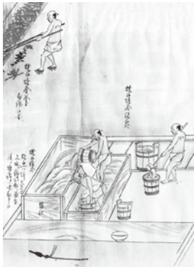
加熱した焼金を冷まし、塩抜きをする。