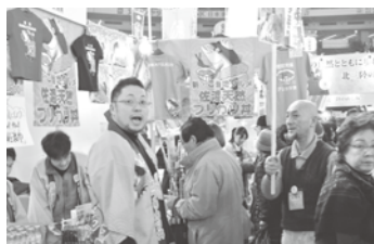
③「佐渡天然ブリカツ丼」のお店で奮闘する皆さん