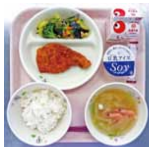
ごはん、牛乳、甘辛トンカツ、海そうサラダ、えびのみそ汁、豆乳アイス