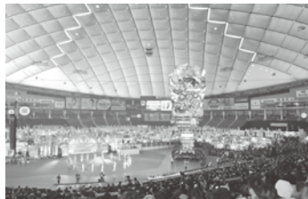
①「たちねぶた」とお祭り広場からの会場風景