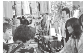
②「佐渡のうまいもと北雪の地酒」のお店で奮闘する皆さん