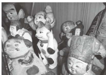
さまざまな種類がある土人形（山本家所蔵）

「文化」と、それを生み出した佐渡島の「大地」を守っていかなくてはならないのです。