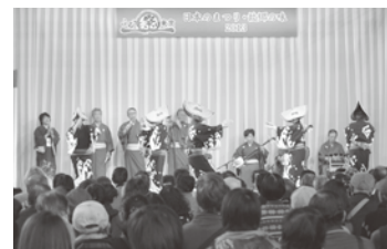
④「佐渡おけさ」を楽しむ観衆