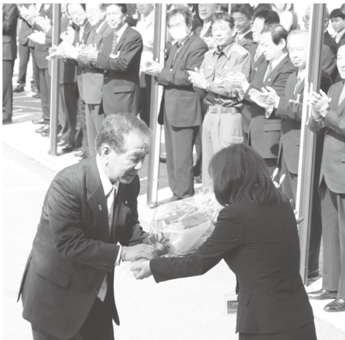
甲斐新市長の初登庁を職員が出迎え

また、定数28から24となった佐渡市議会議員一般選挙も同時に行なわれ、新しい顔ぶれが決まりました（P4に掲載）。