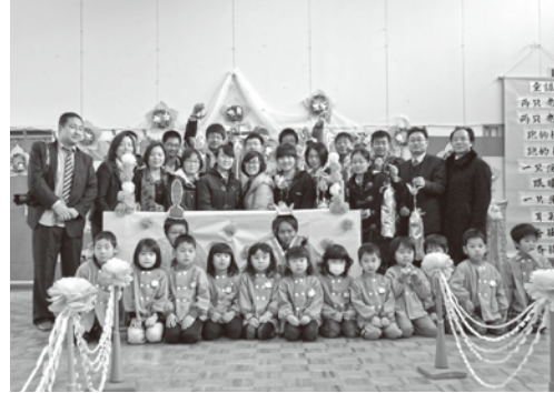
梅津保育園では園児による歓迎の歌や踊りの披露、中国語による童謡の合唱などで交流しました