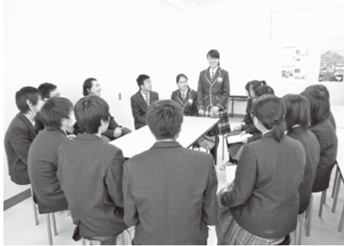
佐渡中等教育学校では英語によるディスカッションや能の謡、琴演奏の披露などで交流しました

佐渡国際交流ネットワーク協議会では（財）自治総合センター宝くじ助成金を受けて、「訪日教育旅行受入モデル事業」を実施しました。その一環として、3月14日～17日に中国江蘇省 こうそ 選抜高校生15人と引率教員5人が教育旅行モニターツアーで佐渡を訪れ、島内視察や各種体験事業を行いました。梅津保育園児童や佐渡中等教育学校生徒と交流を行い、また、生徒の家庭を中心とするホストファミリー宅でホームステイも体験し、参加者同士の相互理解を深めました。