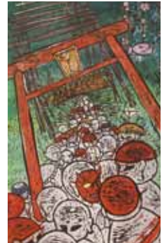
左から、中小企業庁長官賞：島根県立益田高等学校、新潟県知事賞：広島市立安佐北高等学校、佐渡市長賞：島根県立安来高等学校、佐渡版画村賞：島根県立大社高等学校の作品