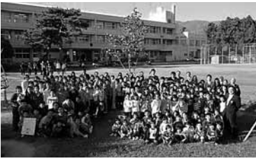
創立110周年記念植樹祭

本校の伝統ある教育活動の一つに、青少年赤十字の活動があります。昭和26年の赤字加盟以来、子どもたちの「気づき、考え、実行する」力の育成に取り組んで