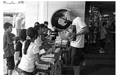
佐渡はすごいっっちゃ大作戦

1学期には、修学旅行で6年生が企画した「佐渡はすごいっっちゃ大作戦・物産展」を万代シテイ