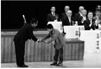
着ぐるみ愛称優秀者への表彰

トキの森公園では、30日と31日の2日間限定で施設を無料開放し、県内外からおよそ2600人の市民や観光客の家族連れなどで賑わいました。トキふれあいプラ