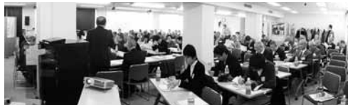
(文責：佐渡市東京事務所、小路 徹)

第二部では観光協会の荒常務理事に、「佐渡版画村美術館」や、「トキふれあいプラザ」など、島内でのさまざまな観光事業の最新情報をご紹介いただきました。第三部の懇親会も補助テーブルを出すほどの盛況で、参加者の交流を深めることができました。