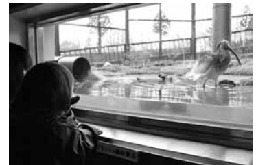
トキふれあいプラザ観察窓からのトキ

ザは、自然に近い環境を整備したケージで飼育されているトキを窓越しに観察することができるため、