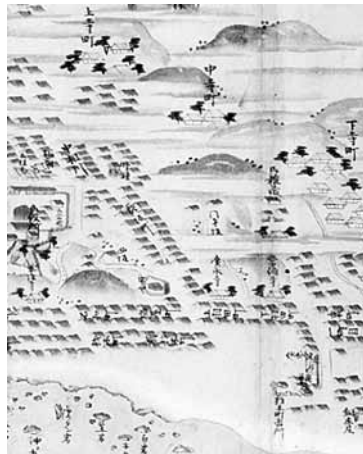
左 明治中頃の相川町(一町目から羽田町・小六町)

寛永12(1635)年4月17日の羽田大火で焼失するまでは、羽田町には間口10間2階建ての屋敷が立ち並んでいました(『佐渡相川志』)。 ◆市役所世界遺産推進課(金井就業改善センター内) ☎63-5136