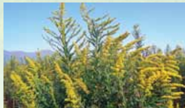
セイタカアワダチソウ(花期は10~11月頃)

法による規制の対象外であるが、すでに日本に持ち込まれ、生態系に悪影響を及ぼすおそれのある動植物が指定されています。