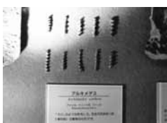
図1 アルキメデス化石 (フォッサマグナミュージアム所蔵)

発明家でもあったアルキメデスは、ネジを発明した人でもあります。彼は、あの螺旋構造をどこで、何を見て思いついたのでしょうか？さて、みなさんはどう考えますか？