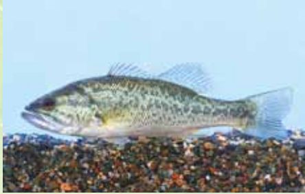
オオクチバス(ブラックバス)

「特定外来生物による生態系等に係る被害の防止に関する法律」により、指定のある動植物については、飼育・栽培・保管・運搬・販売・譲渡・輸入が原則として禁止されています。販売等の目的で特定外来生物を飼育、栽培した場合など悪質な違反をした場合、懲役または罰金が科せられることがあります。