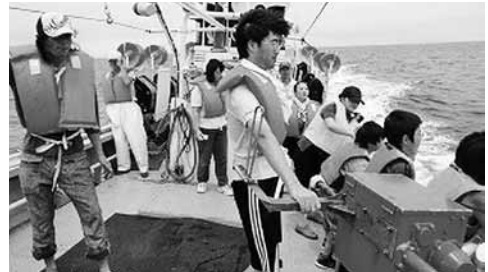
漁船乗船・魚さばき体験