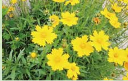
オオキンケイギク(花期は6~7月頃)