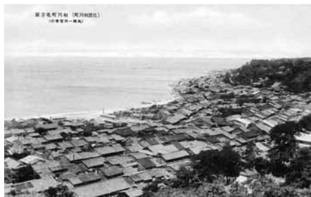
右 天保13(1842)年「佐渡一国海岸図」より羽田町の部分

羽田の町立てが始まるのは、寛永4(1627)年2月のこと。佐渡奉行となった竹村九郎右衛門は、古文書によると下戸・羽田の百姓屋を「町屋敷四町、家数百二十ヶ所、理不尽に御追放なされ、その跡を有徳(富裕な)成る町人共の下屋敷」とし、強引な町立てを行いました。