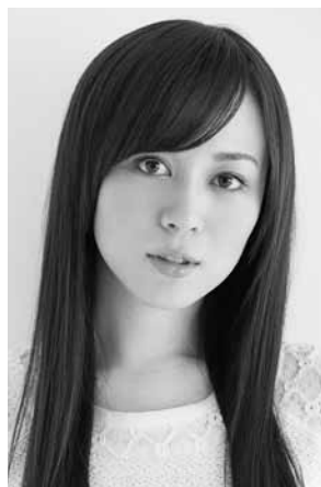
比嘉 愛未(ひが まなみ)さん