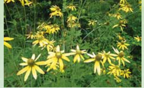
オオハンゴンソウ(花期は7~8月頃)