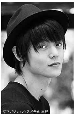
窪田 正孝(くぼた まさたか)さん