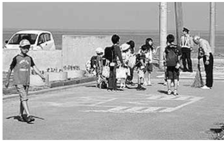
校長先生に元気よくあいさつ

日本海と大佐渡山地に挟まれた高千・外海府地区は、景勝の美を競うと同時に、冬期間の強風による自然の厳しさは生活に支障をきたすほどです。その分、地域の子どもに対する愛情と期待は大きく、高千・外海府地区青少年育成協議会が主催する行事が行われるなど、地域と学校が連携し