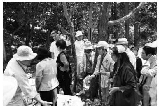
鶴子銀山見学の様子

旅行運営に当たり、佐渡市関係者の皆さまに大変ご協力いただき、ありがとうございました。