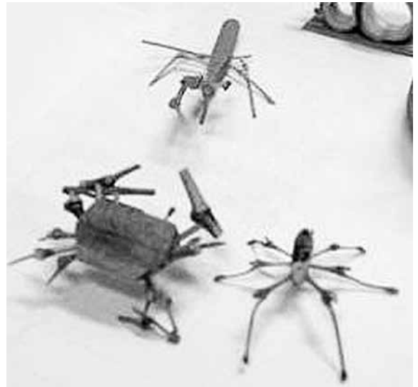
竹を使った虫づくり体験