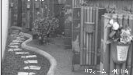
リフォーム 相川橋