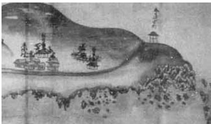
近世中期相川町絵図(部分)に描かれた春日崎。先端にあるのが灯明台