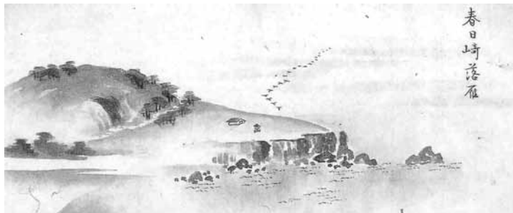
相川八景「春日崎落雁」の図(部分)