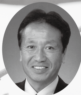
東京都国分寺市長 井澤 邦夫

結びに、貴市のますますのご発展と貴市市民のご多幸とご健勝を祈念申し上げ、新年のご挨拶いたします。