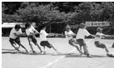
松ヶ崎地区連合運動会

6月には、松ヶ崎地区連合運動会が行われます。小中学生混合の種目もあります。運動会当日は、地域の方々から小中学生、保育園児まで参加し、