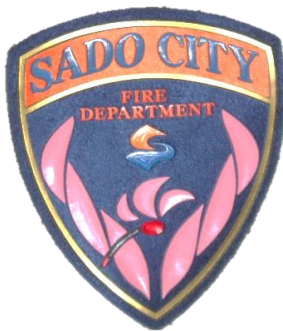
佐渡市消防本部 エンブレム