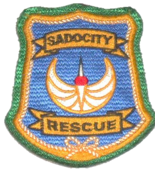
佐渡市救助隊 エンブレム