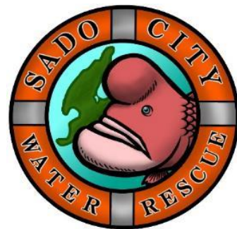
佐渡市水難救助隊 エンブレム