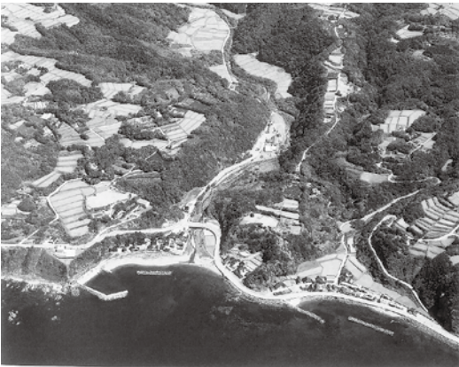
能登の砂鉄掘り衆が砂金を採ったとされる西三川河口