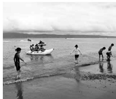
ジェットスキー、バナナボート体験

その他、そば打ち体験やもの作り体験、交流バーベキュー等、4日間にわたる日程の中で子どもたちは交流を深め、お別れの時には最後まで握手をし、手を振ってお互いに別れを惜しんでいました。