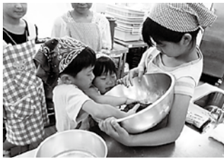
力いっぴいにこねる参加者

講師の方が、その場であずきを煮てくれ、だんごにあんこがたっぷりかかった草だんごができました。