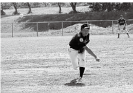
力投する赤泊チームのエース