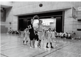
狙いすましてジャンプシュート

また、競技終了後に開催された「友好の夕べ」を通して『友好と親善』を益々深め、「来年また会おう!」と共に誓い今大会は幕を閉じました。