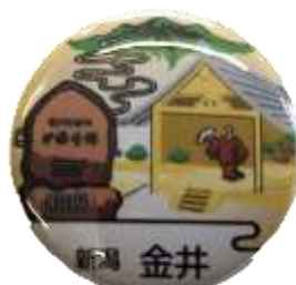
金井郵便局 オリジナル缶バッジ