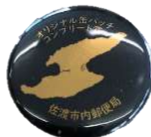
オリジナル缶バッジ コンプリート賞