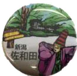
佐和田郵便局 オリジナル缶バッジ