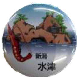
水津郵便局 オリジナル缶バッジ