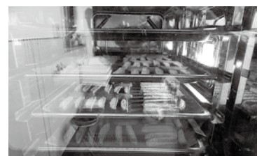
じっくり二度焼き中