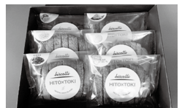
6種のビスコッティ

Mail: challengedtateno@hitoxtoki.jp FB: https://www.facebook.com/challengedtateno