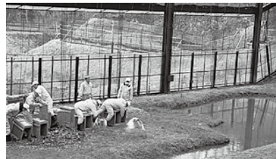
順化ケージ内へ放鳥する様子