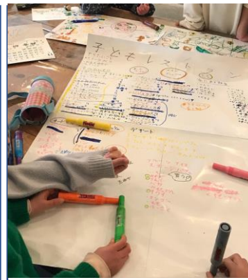
子どもレストラン (子どもの就業体験)