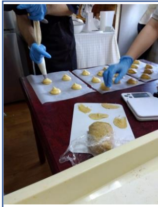
(障がいなど一般就労が困難な方への就業体験)