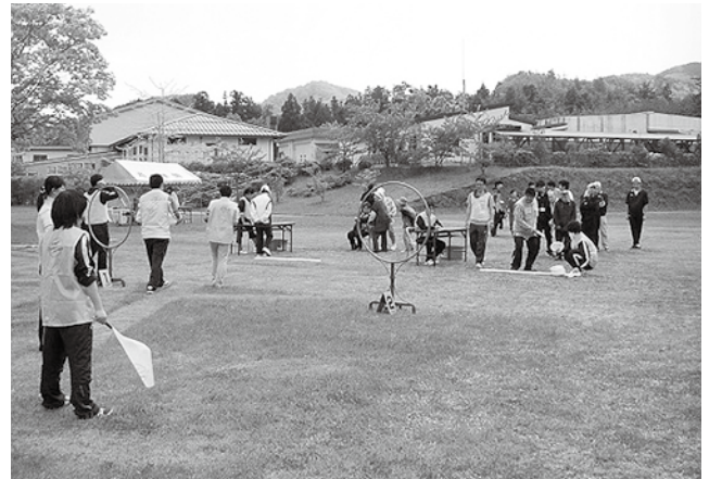
向きの変わる強い風の中、みんな集中して大会に臨みました。

協会では、今後も障がいのある方がスポーツに親しむ機会を増やしていきたいと、秋にも大会を開催する予定ですので、多くの皆さまのご参加をお待ちしています。