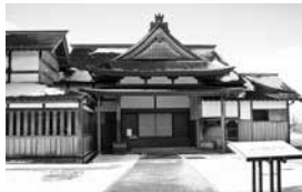
復原された佐渡奉行所

相川が佐渡の行政の中心地となり、佐渡陣屋(佐渡奉行所)が拠点となつて佐渡の隅々まで管轄する体制が整えられたのです。この大きな目的は、皆さんがご存知の通り、近世(安土桃山から江戸時代)初頭に相川の山中に金銀山が開発され、それを管理することでした。