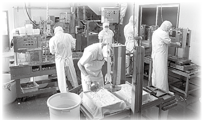
「みんな仲間」を合言葉にがんばっています