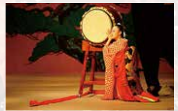
ゆきあひ