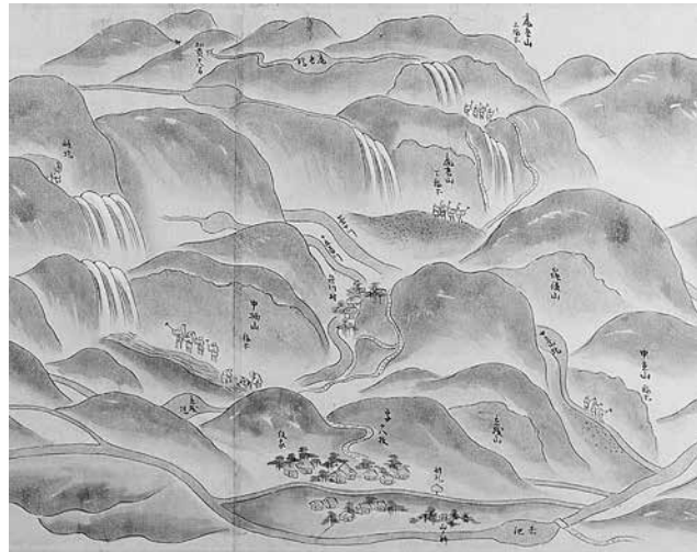
中柄山や虎丸山で稼ぐ金児が描かれている(西三川砂金山稼場所図)

なっただため、4人余りの人足が十五番川で札穿になっています。また、鶴峠山も不景気で休山となり、3人が川々を稼ぐ札穿となっています。砂金山が最盛期を過ぎた時代になると、西三川砂金山から移動することなく、川で細々と砂金を採りながら、開発が進んだ耕地で生計をたてる人々が多くなっていくようです。 ◆市役所世界遺産推進課(金井就業改善センター内) ☎63-5136