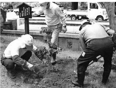
黒木御所跡の植樹を行う保存会の人たち

今回の表彰は、郷土の文化財を長年にわたって愛護し、普及させてきた住民主体の取組みと功績を称えるものです。おめでとうございます。