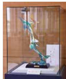
「シュプリング」宮田亮平作