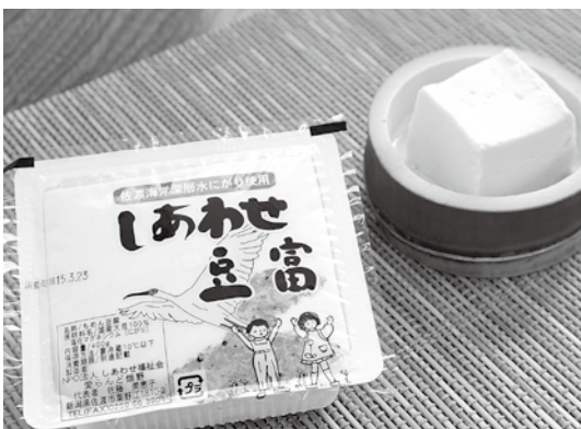
国産大豆100%使用「しあわせ豆腐」