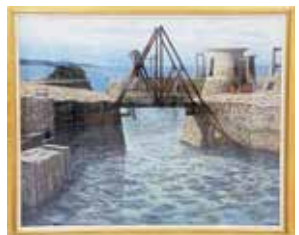
「Hello, again」 今城 俊雄 作