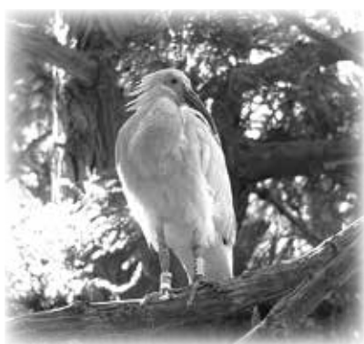
巣立ちしたひな