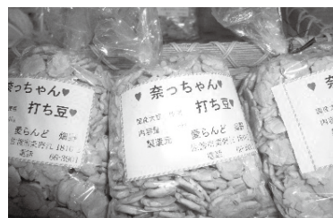
一つひとつ手作りで 「奈っちゃん打ち豆」

◆ご注文のお問い合わせ先 〒952-0202 佐渡市栗野江1810番地2 障害福祉サービス事業所 愛らんど畑野 ☎66-3901 (FAX共通)