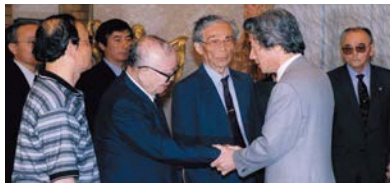
控訴断念するかどうかの最終判断をする直前に、ハンセン病訴訟原告代表と面談する小泉内閣総理大臣(当時)

熊本地裁の判決に対し、国は控訴※断念を決めるとともに、内閣総理大臣談話を発表し、ハンセン病問題の早期解決に取り組む決意を表明しました。しかし判決後も、熊本県で入所者に対するホテル宿泊拒否事件が起き、これが報道されると、今度は元患者に対する誹謗中傷が行われる事態に発展するなど、残念ながら入所者や社会復帰者、その家族に対する偏見や差別には根強いものがあります。そのため、療養所の外で暮らすことに不安を感じ、安心して退所することができないという人もいます。