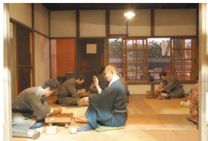
昔の療養所の暮らしが再現されています

〒189-0002 東京都東村山市青葉町4-1-13 電話 042-396-2909 URL http://www.hansen-dis.jp/