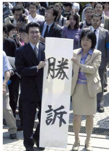
熊本地裁での勝訴発表

熊本地裁判決の日に 原告が勝訴の感動を綴った詩 太陽は輝いた 90年、長い長い暗闇の中 一筋の光が走った 鮮烈となって 硬い殻を砕き 光が走った 私はうつむかないでいい みんなと光の中を 胸を張って歩ける もう私はうつむかないでいい 太陽は輝いた