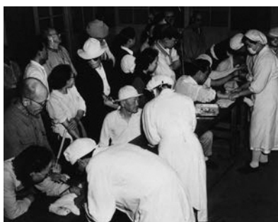
治療薬「プロミン」の注射

ハンセン病患者の隔離政策は、「癩予防法」という法律のもとで進められました。昭和28年（1953年）、患者の反対を押し切ってこの法律を引きつぐ「らい予防法」が成立しました。この法律の問題点は、患者隔離が継続され、退所規定が設けられていないことでした。つまり、ハンセン病患者は療養所に収容されると、一生そこから出ることが出来なかったのです。昭和21年にハンセン病の特効薬「プロミン」が登場し、その後、新しい飲み薬タイプの治療薬が開発され、ハンセン病は適切な治療をすれば治る病気になっていました。にもかかわらず、患者の強制収容が続けられたのです。昭和30年前後から徐々に規制が緩和され、病気が治って自主的に退所する人たちも出てきました。しかし彼らは療養所に入所する際に、社会や家族と断絶させられており、療養所の外では頼る人はなく、救いの手を差し伸べる人も、受け皿もなかったのです。そのような状況の中で、生活苦で体を壊したり、病気を再発させたりして、やむなく療養所に戻る人も少なくありませんでした。