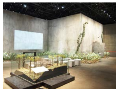
縮尺1/20の模型(手前)と実寸大で部分再現された重監房

〒377-1711 群馬県吾妻郡草津町草津白根464-1533 電話 0279-88-1550 URL http://sjpm.hansen-dis.jp/