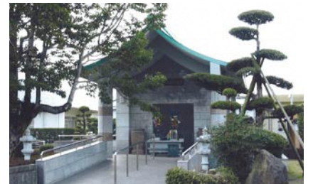
星塚敬愛園の納骨堂

高齢や後遺症、周囲の偏見などを乗り越えて、療養所を退所して社会復帰した人もいますが、その数は決して多いとはいえません。療養所に入所したときに、家族に迷惑が及ぶことを心配して本名や戸籍を捨てた人もいるため、現在も故郷に帰ることなく、肉親との再会が果たせない人もいます。療養所で亡くなった人の遺骨の多くが実家のお墓に入れず、各療養所内の納骨堂に納められています。