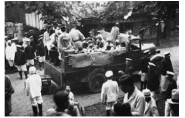
患者の収容には警察官が立ち会った

19世紀後半、ハンセン病はコレラやペストなどと同じような恐ろしい伝染病であると考えられていました。当初は、家を出て各地を放浪する患者が施設に収容されましたが、やがて自宅で療養する患者も収容されるようになりました。ハンセン病と診断されると、市町村や療養所の職員、医師らが警察官を伴ってたびたび患者のもとを訪れました。そのうち近所に知られるようになり、家族も偏見や差別の対象にされることがあったため、患者は自ら療養所に行くしかない状況に追い込まれていったのです。このような状況のもとで、昭和6年(1931年)にすべての患者の隔離を目指した「癩予防法」が成立し、療養所の増床が行われ、各地にも新しく療養所が建設されていきました。また、各県では「無癩県運動」という名のもとに、患者を見つけ出し療養所に送り込む施策が行われました。保健所の職員が患者の自宅を徹底的に消毒し、人里離れた場所に作られた療養所に送られていくという光景が、人々の心の中にハンセン病は恐ろしいというイメージを植え付け、それが偏見や差別を助長していったのです。