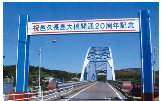
人間回復の橋と呼ばれる邑久長島大橋

長島と対岸の虫明を結ぶ邑久長島大橋は、1988年(昭和63年)に開通しました。隔離する必要のない証、人間回復の証として架橋され、現在は民間バスも乗り入れ、入所者も自由に島外に出かけられるようになっています。