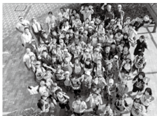
子どもたちの「笑顔」と「かばん」に入りきらぬ「お土産」が、とても印象的でした。

参加した子どもたちは、親元を離れ、初めてづくしの経験をすることで、一まわりも二まわりも大きく成長し、無事に佐渡へ帰ってきました。