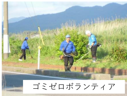
ゴミゼロボランティア