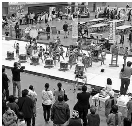
平泉保育園児による平泉太鼓

お馴染みの物販「佐渡まるごとふれあい市」や「食育コーナー」「スイーツコンテスト販売会」「のまんかさキャンペーン抽選会」のほか、今年度はフェスタのオープニングを平泉保育園の「平泉太鼓」が飾ったほか、「にいがた朝ごはんプロジェクト試食投票会」も開催され、盛りだくさんの内容となりました。