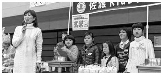
佐渡まるごとふれあい市

生産者と消費者が対面販売を通じて、互いのニーズを交換する物販です。28店舗が参加し、佐渡の生鮮食品や加工食品の販売、飲食コーナーを展開しました。今年、佐渡市工業会による展示ブースも設け、各社が独自の技術の発信やPRを行いました。