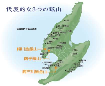
代表的な3つの鉱山

相川金銀山が所在する相川地区の市街地に位置し、最新の映像技術を駆使して佐渡金銀山の魅力や価値をわかりやすく紹介する展示室のほか、史跡やまち歩き、島内観光情報等を提供する総合インフォメーション機能を備えています。また、講堂や中庭を活用したマルシェ、コンサートなどファミリー層向けのイベント開催により、来訪者と地域をつなぐコミュニティ機能を備え、現地への情報発信だけでなく、地域の交流拠点としての役割を担っています。