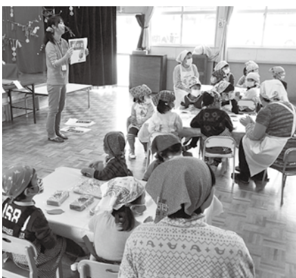
園児に佐渡島の成り立ちを説明するジオパーク推進室職員

佐渡ジオパーク推進協議会では、昨年に引き続き、佐渡ジオパークの公式ロゴマークをかたどった型を制作しました。一部の公民館等で貸し出しています。興味・関心のある方は、ジオパーク推進室までお問い合わせください。