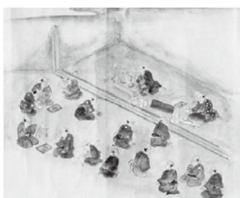
「金入り」の場面 「西三川砂金山稼場図」より(新潟県立歴史博物館蔵)

4日朝に、砂金の包みを筋金所から御金蔵に移します。そこで、組頭が立会い、包みの砂金を再度改め、「砂金請取証文」が渡されます。西三川金山役は、この証文と引き換えに、御金蔵で金児に渡す砂金の代錢を受け取り、5日に西三川へ戻ります。