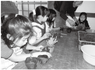
愛情を込めて作った「こけ玉」

体験内容は、ジオパークのおこし型作り、調理実習、竹とんぼ作り、こけ玉作りです。男の子は竹とんぼ作り、女の子はこけ玉づくりが楽しかったとの感想でした。保護者と離れて生活する経験ができ、市内の児童の交