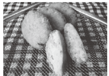
おからの入った手作りコロッケ