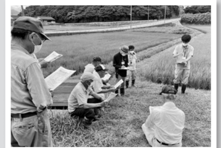
サポーターほ場での穂肥指導会