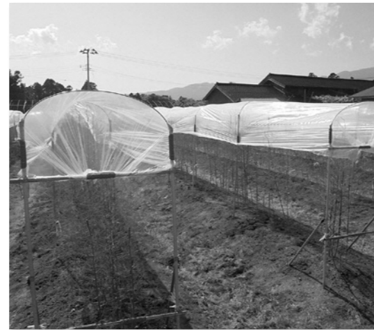
アスパラガスの生産性向上に必須な雨よけ栽培の様子

新規に栽培を始める方には、初心者向け研修や新規導入に掛かる経費の支援など、安心して取り組めるようサポートしますので、興味のある方は気軽にご相談ください。