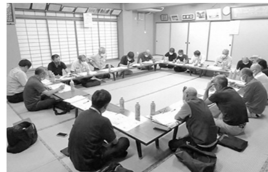
法人化検討の様子(琴浦集落)