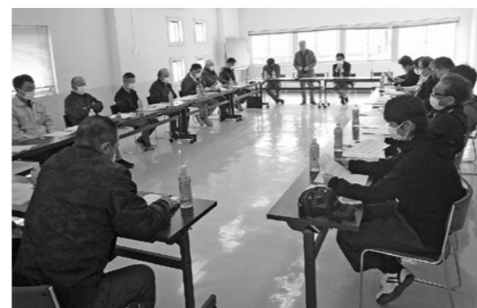
法人間連携に向けた協議の様子

令和5年度は、重点地区において「地域計画」の策定や、「農地の集積・集約化」を進め、また、JA佐渡新穂事業所管内で設立された「新穂地区農業法人連携協議会」の活動を通じて、法人間連携を進めるなど地域の担い手の経営基盤の強化を支援していきます。