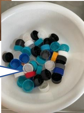
ペットボトル キャップを集め、 世界の子も達 にワクチンを