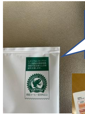
職員休憩時に、 レインフォレスト アライアンス 商品の利用