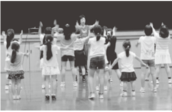
リズムに合わせて楽しくダンス!

また練習成果の発表の場として、1月に「楽しく踊ろう!はじめてのキッズダンス教室ダンス発表会」の開催や、2月に開催予定の金井芸能発表会にも参加を計画しています。