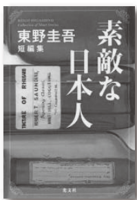
「素敵な日本人」 東野圭吾 著