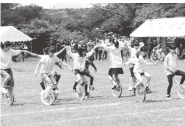
会場全体を楽しませた 羽茂小学校一輪車クラブの皆さん

また、羽茂小学校一輪車クラブのアトラクションも大いに盛り上がり、参加した小学生に大きな歓声が上がっていました。