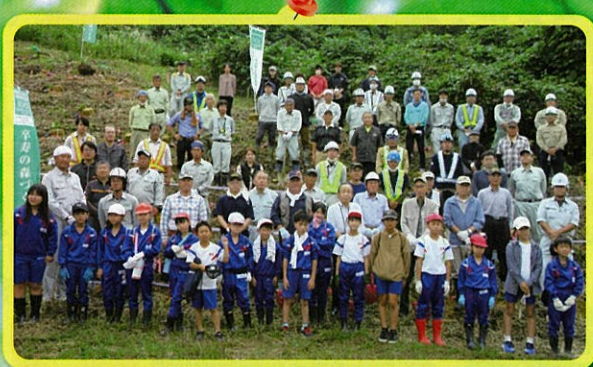
卒寿の森(1人16本の木を植える)活動 (卒寿の森づくり実行委員会・三条市)