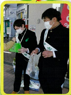
徹底したコロナ対策で「緑の募金」活動を実施(小出中学校・魚沼市)

県民の皆様ご協力ありがとうございました。 寄せられた「募金」は、さまざまな緑に変わりました。