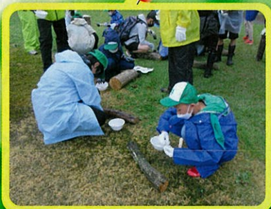
「木を植えて、育てる」から「活かす」活動へ (特色のある緑の公園を造る会・村上市)