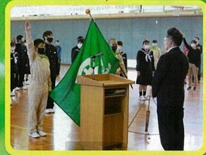
緑の少年団に新たな団員が加入 (佐和田中学校・佐渡市)