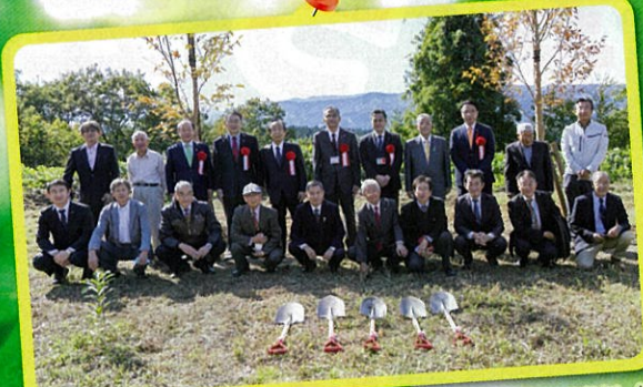
植樹等活動を終えたボランティア団体から市へ「森の引渡し」 (十日町市民協働の森づくり実行委員会・十日町市)