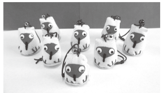
愛嬌あるトキの根付け

両津湊343番地46 障がい者福祉サービス事業所 あんずの家 ☎23-3303 FAX23-3306