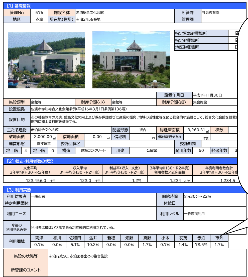
佐渡市公共施設カルテ