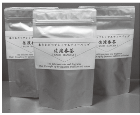
深い味わいと上品で芳醇な香りを封じ込めた一品！