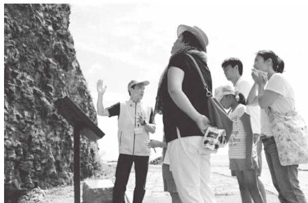
育成されたガイドによる現地案内