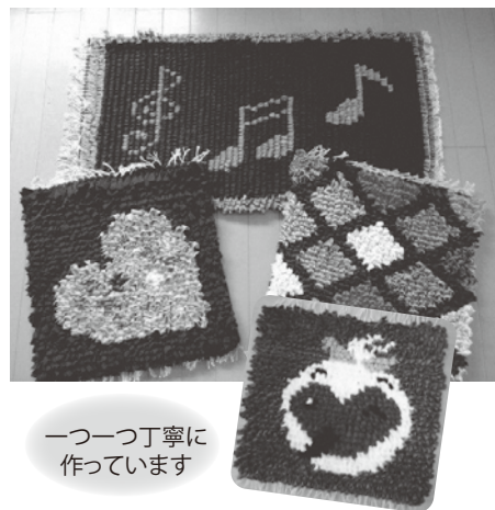
一つ一つ丁寧に作っています