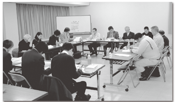
設立準備会の検討の様子